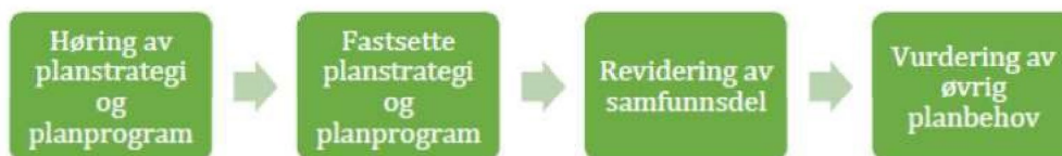
Figur: Forenkla framdriftsplan av prosess frem mot vurdering av øvrig planbehov, sett i samanheng med revidering av samfunnsdel.

Planstrategien for 2024–2027 tek først og fremst sikte på at kommuneplanens samfunnsdel skal reviderast, samt at enkelte strategiske overordna planar kjem i gong i 2024. Etter at kommuneplanens samfunnsdel er vedteken, vil det bli gjort ei vurdering av utvida planbehov for kommunestyreperioden. Planstrategien må då reviderast.